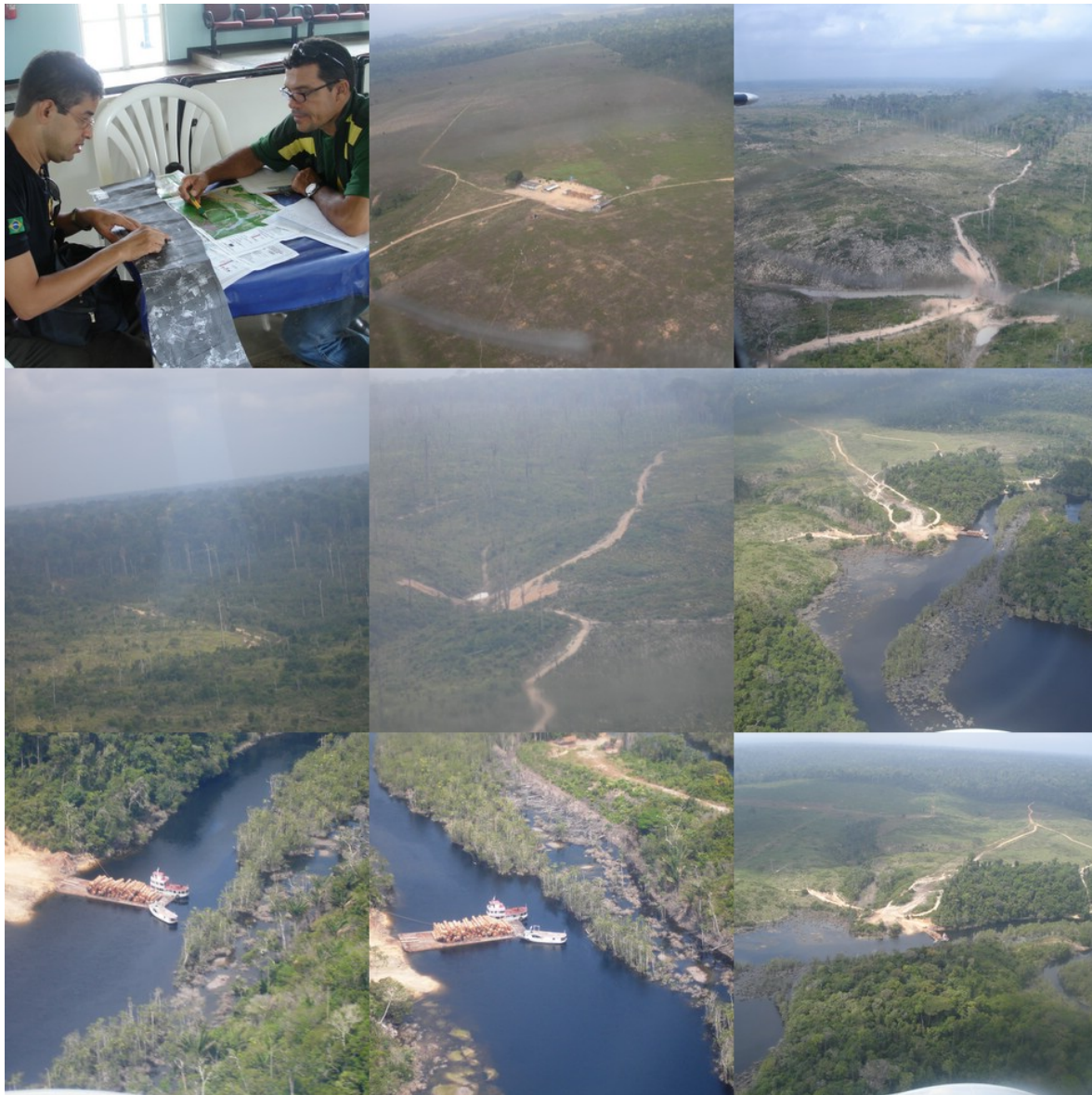
Figura 4 – Fotos tiradas no sobrevôo ocorrido no dia 25 de agosto de 2006