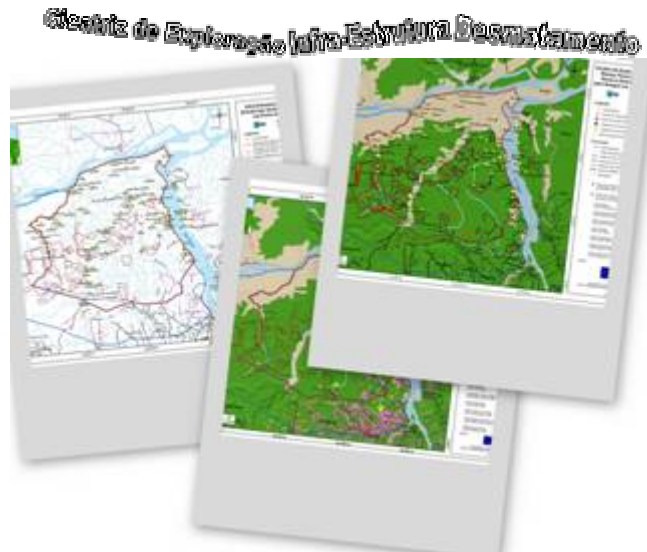
Fig 1 - Série de mapas do diagnóstico da Reserva

Julho e Agosto - O IEB e o IMAZON investiram na elaboração de mapas que traçassem um diagnóstico da área da ResEx Verde para Sempre em Porto de Moz. A montagem da base de dados durou 1 semana, as análises e interpretações visuais juntamente com a tabulação dos dados mais uma semana, por fim nas duas últimas semanas foram elaborados os mapas de: desmatamento, cicatriz de exploração, estradas não-oficiais e focos de calor.